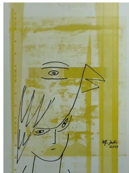
O.T., Edding auf Alu, 74 x 61 cm, 2017