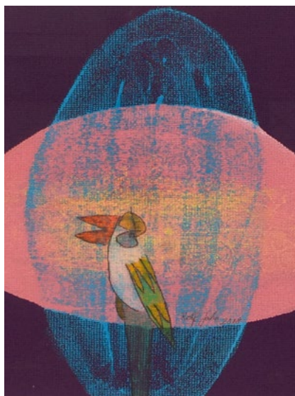
O.T., 50 x 40 cm, Acryl, Stift auf Tapete, 2018