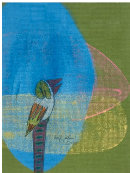
O.T., 50 x 40 cm, Acryl, Stift auf Tapete, 2018

Ursula Clemens-Schierbaum Kunsthistorikerin